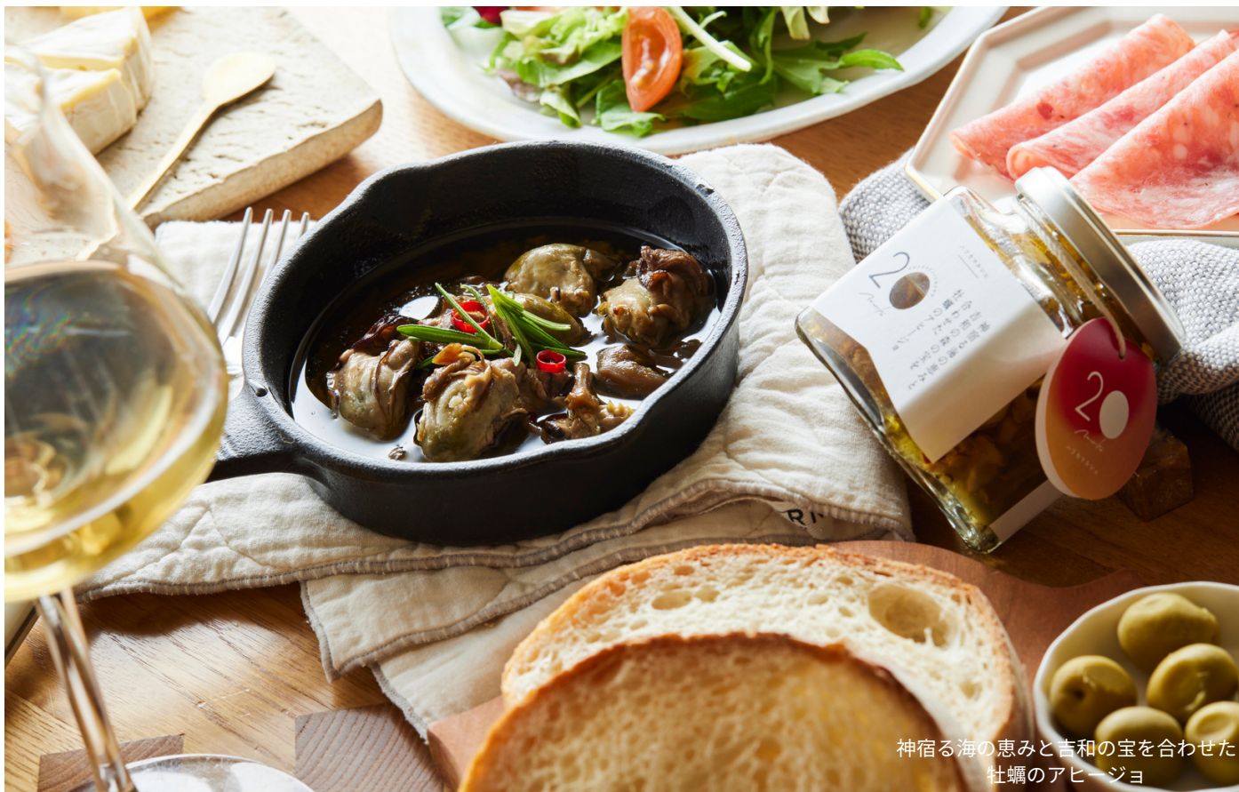
神宿る海の恵みと吉和の宝を合わせた 牡蠣のアヒージヨ

廿日市市の食ブランド 「ハツカマルシェ® (20marce)」がお届けする 廿日市内の食文化レポートです。