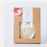
はつか大地のお米パスタ

水と緑のまち、廿日市市佐伯にある家族経営の小さな農園。農業女子プロジェクトのメンバーである姉妹でお米、少量多品目の野菜の栽培、加工品作りや農業体験など、女性目線で食べる人によりそった農業を営んでおり、農園では年に4回程度収穫祭や春祭り、夏祭りなどを行っています。海から山までの自然豊かな廿日市の恵みをいかして、次世代へ昔ながらの農と食文化の伝承を心がけています。